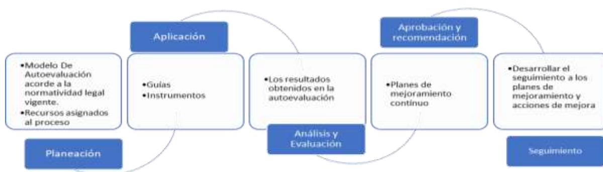
Figura 5. Funciones del Comité autoevaluación y autorregulación en el CEA