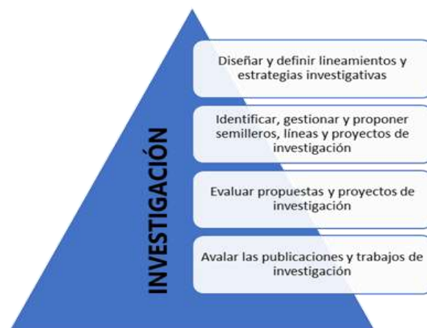
Figura 4. Funciones relacionadas con la investigación en el CEA

Fuente. Construcción propia a partir de la resolución 3057 de 2017.